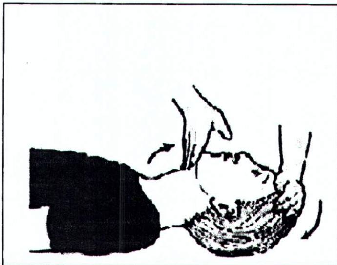
Рис. 2. Маневр открытия верхних дыхательных путей путем запрокидывания головы.

Контролируйте эффективность вдоха по экскурсии грудной клетки. Для детей старше 1 года при отсутствии мешка Амбу используйте методику дыхания рот в рот (зажимая ноздри).